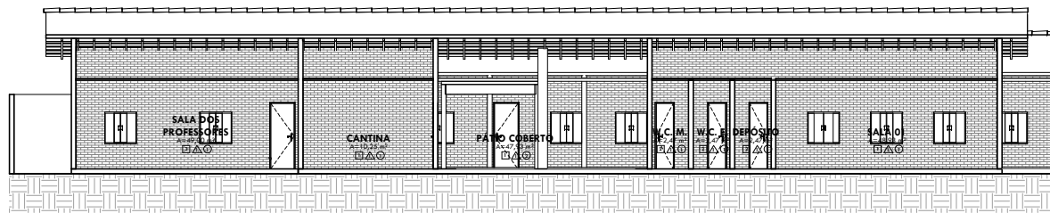
3 A ESCALA 1:75